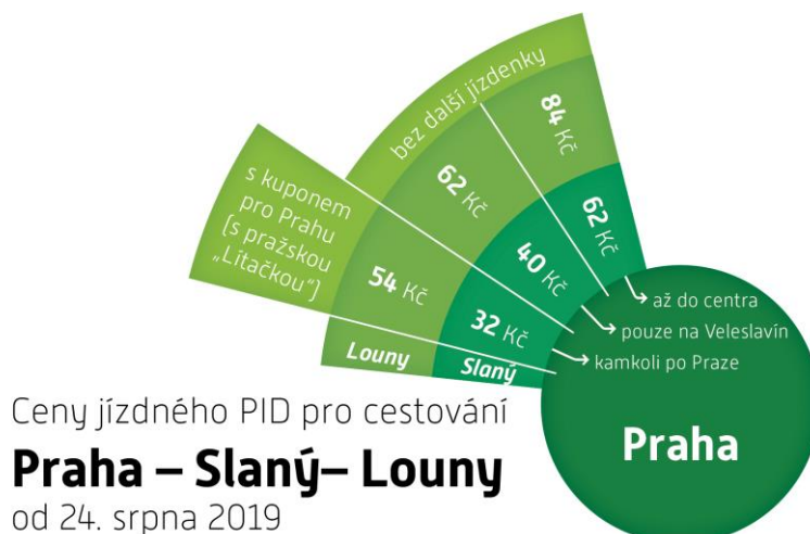
Ceny jízdného PID pro cestování Praha – Slaný– Louny od 24. srpna 2019

Základní cena jízdenky mezi Slaným a Prahou (Nádraží Veveřslavín) je 40 Kč (5 tarifních pásem B+1+2+3+4, časová platnost 120 minut). Pro kombinaci s MHD v Praze vyjde jedna jízdenka na 62 Kč (8 pásem, časová platnost 210 minut). Naopak při kombinaci s předplatní jízdenkou pro Prahu vyjde jedna cesta do Slaného na pouhých 32 Kč .